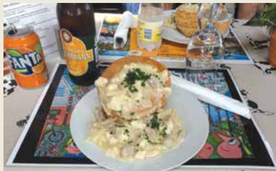
Tartelet med høns i asparges

Sidste dag var hjemrejsedag, så efter endnu et lækkert og overdådigt morgenbord forlod vi Agerskov Kro med kursen til Alrø, som ligger i Horsens fjord, med dæmning fra nordsiden af fjorden. Målet var endda mere direkte, nemlig Cafe Alrø.