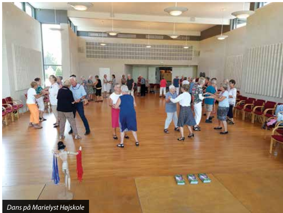
Dans på Marielyst Højskole