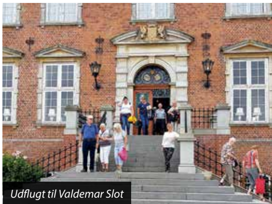
Udflugt til Valdemar Slot

Alt for hurtigt blev det sidste aften, hvor vi sluttede med festmiddag og dans og derpå underholdning af ”Visens Venner”, der sideløbende med os havde været på kursus. Efter morgenmaden og samling næste morgen tog vi afsked med skolen og vore nye