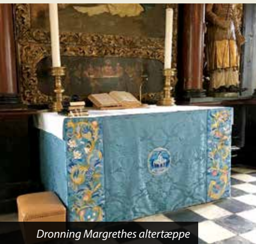
Dronning Margrethes altertæppe